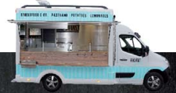
GAMO finden Sie auch auf: